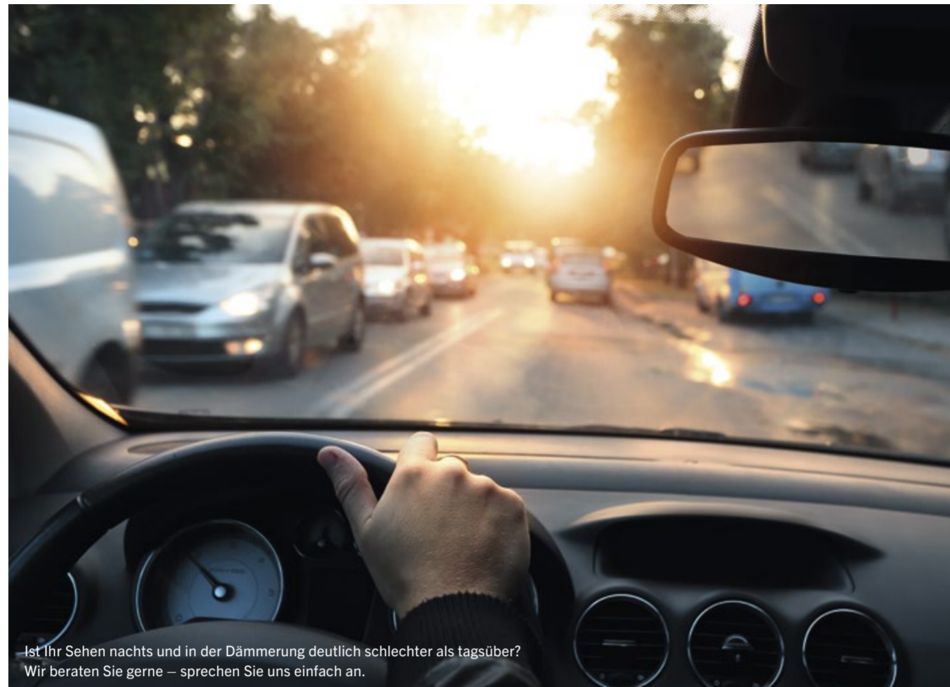
Ist Ihr Sehen nachts und in der Dämmerung deutlich schlechter als tagsüber? Wir beraten Sie gerne – sprechen Sie uns einfach an.

Produziert wurde diese Ausgabe für/im Auftrag von OPTIK-KLIMMEK GMBH, Marzahner Promenade 1a · 12679 Berlin