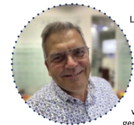
Liebe Kundin, lieber Kunde,

wäre es nicht großartig, eine Gleitsichtbrille zu besitzen, deren Gläser absolut individuell auf Ihre Augen abgestimmt sind?